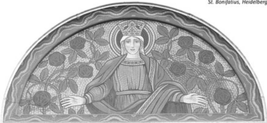
St. Bonifatius, Heidelberg

Im Mai feiert die Kirche die Gottesmutter Maria als Maienkönigin. Mitten im Frühling symbolisiert sie das blühende Leben, da sie Jesus das Leben geschenkt hat, durch den Gottes gute Schöpfung von der Vergänglichkeit des Todes erlöst wurde.