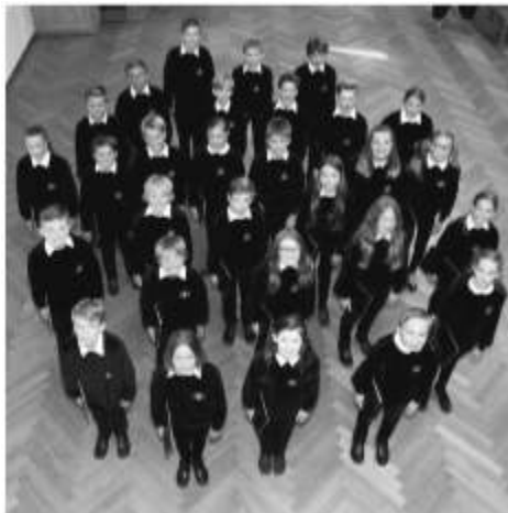
Kapellsingknaben und Mädchenkantorei Altötting