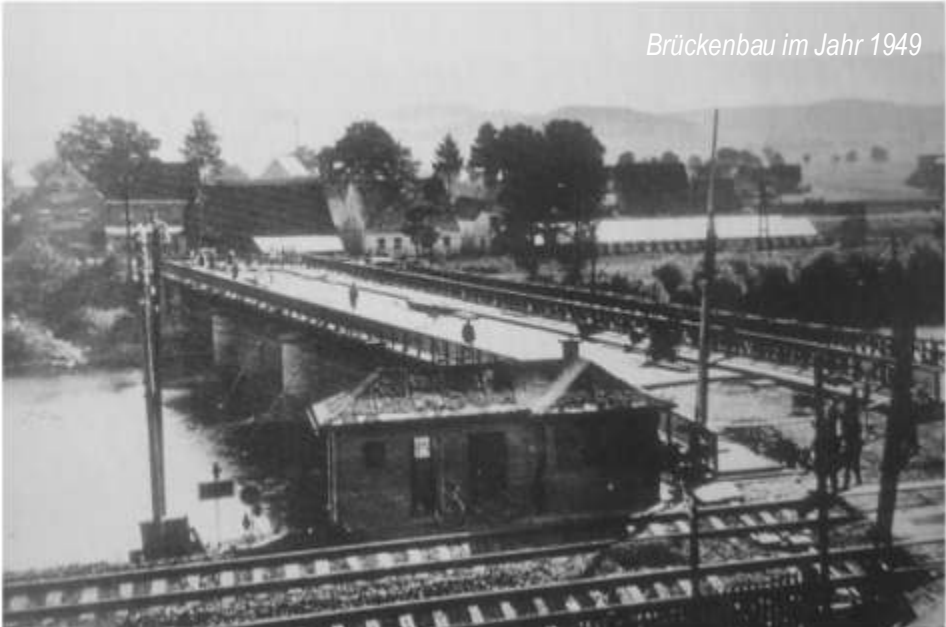
Brückenbau im Jahr 1949

zeigt uns Raphael Haubelt Luftbilder von Nabburg aus den 50er und 60er Jahren, die in unterhaltsamer Weise gemeinsam kommentiert und erklärt werden dürfen.