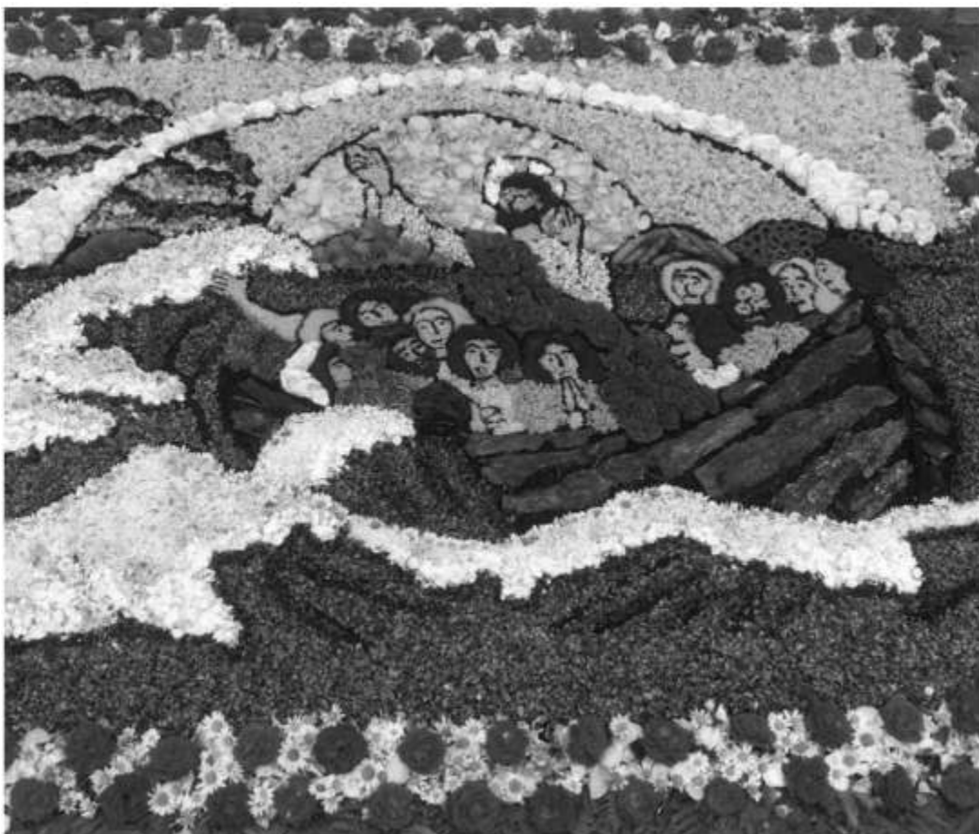
Blumenteppeich des Frauenbundes aus dem Jahr 2020

FRONLEICHNAM - Jesus Christus wohnt in unserer Mitte - steht an unserer Seite - geht mit uns!