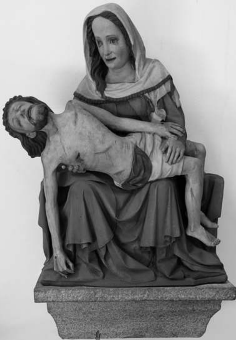
Pieta im Haupteingang der Pfarrkirche