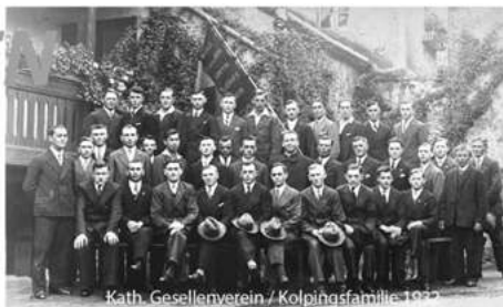
Kath. Gesellenverein / Kolpingfamilie 1922