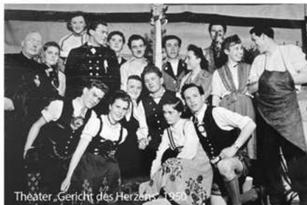
Theater „Gericht des Herzens“ 1950