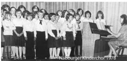
Nabburger Kinderchor 1978