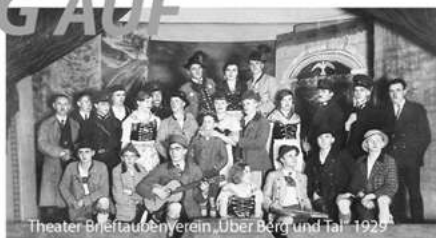
Theater Brieftaubensverein „Über Berg und Tal“ 1929