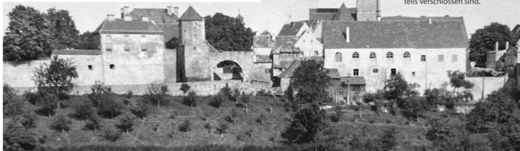
Anfangs hatte der Bau nur 5 Rundbogenfenster, die hier, so scheint es, teils verschlossen sind.