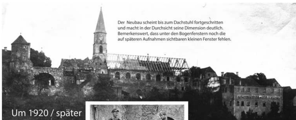
Der Neubau scheint bis zum Dachstuhl fortgeschritten und macht in der Durchsicht seine Dimension deutlich. Bemerkenswert, dass unter den Bogenfenstern noch die auf späteren Aufnahmen sichtbaren kleinen Fenster fehlen.

Am Freitag, 22.11. um 19:00 Uhr lädt der Pfarrgemeinderat zum großen Bilder-Rückblick ins Jugendwerk ein. Raphael Haubelt zeigt und erklärt die Bilder, die seit Juli an den Fenstern des Jugendwerks befestigt sind und an dieser Stelle in jedem Pfarrbrief einen Einblick in die bewegte Geschichte unseres Hauses zeigen. Darüber hinaus hat er aufschlussreiche Infos aus Zeitungsberichten u.a. von der Einweihung vor 100 Jahren! Lassen Sie sich diesen Rückblick auf die vergangenen 100 Jahre Pfarreigeschichte im Jugendwerk nicht entgehen!